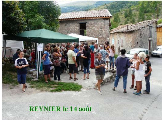
REYNIER le 14 août

Du nouveau à La Sapie (commune de REYNIER)