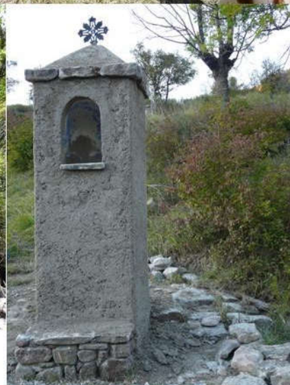
Un grand merci aux deux employés communaux venus dégager l'accès à l'oratoire bien encombré après un orage spectaculaire.